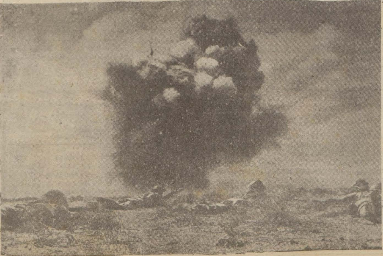
Şimalî Afrikada bir harb sahnesi

İ — Mısır cephesinde: Mareşal Rommel'in üçü zirhlî (bunların ikisi 15 inci ve 21 inci Alman zirhlî tümenleridir) olmak üzere azami altı tümenden ve büyük bir hava kuvvetinden müteşekkil olan şimalî Afrika Mihver ordusile Cumartesi gününden itibaren Mersa Matruh ile bunun 50 kilometre kadar cenubu garbisindeki Sidi Hamza mevkiî arasında bulundukları (Devamı 5 inci sayfada)